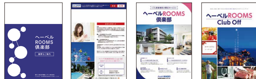
【お送りする資料一式】

サービスのご利用に必要なID・パスワードはお申込み完了後にお送りする資料一式内の、「重要なお知らせ」に記載されております。